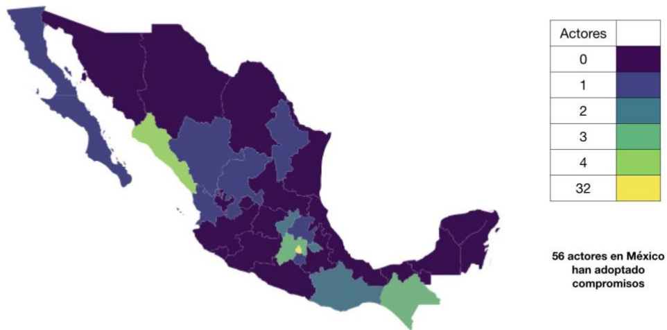
#AdoptaUnCompromiso de Apertura y Anticorrupción por entidad

Cuadro que muestra por entidad federativa, el número de actores que participan en la campaña a nivel nacional: